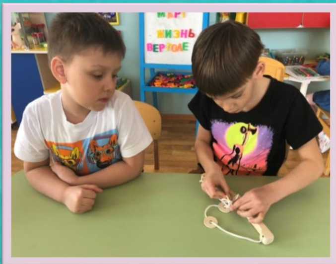
Игра-головоломка «Стоимостью пяти лошадей»