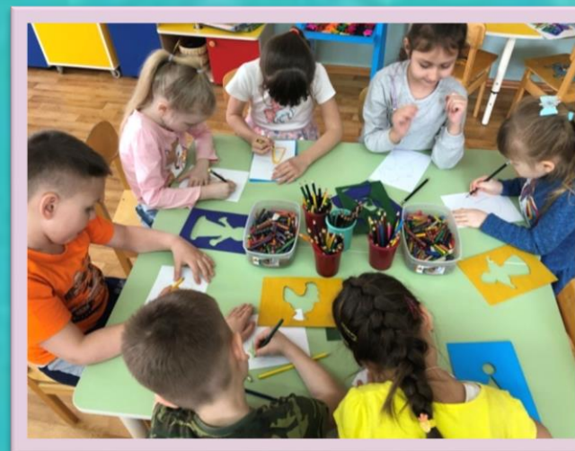
Рисование по трафаретам