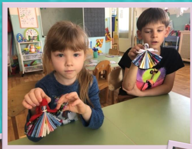
Ручной труд «Кукла Акань»