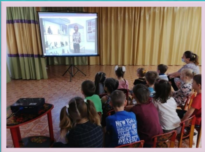
Виртуальная экскурсия «Музей народной игрушки»