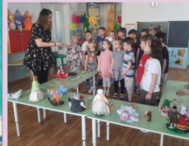
Знакомство с игрушками народов Северного Кавказа