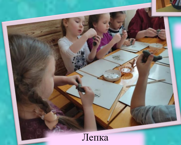
Лепка «Уточка- свистулька»