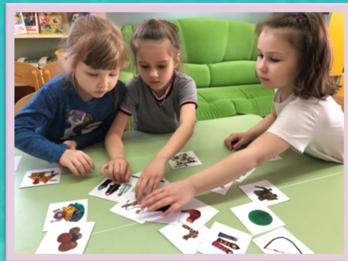
Дидактическая игра «Покажи и назови»