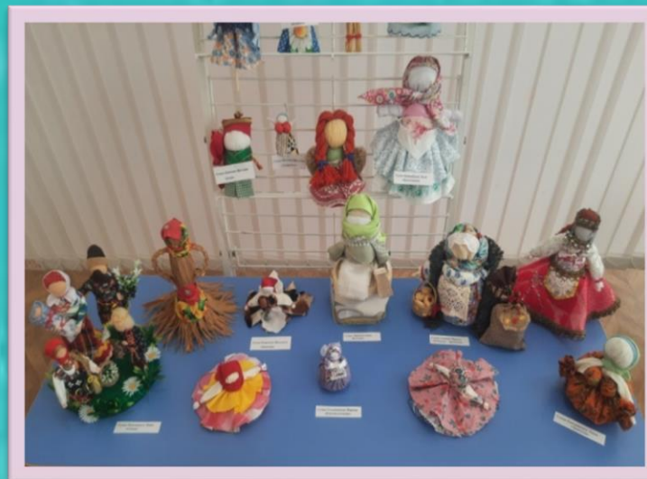
Выставка детско-родительских работ «Кукла с русской душой»