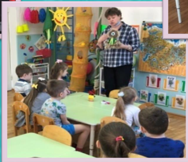
Знакомство с игрушками народов Севера