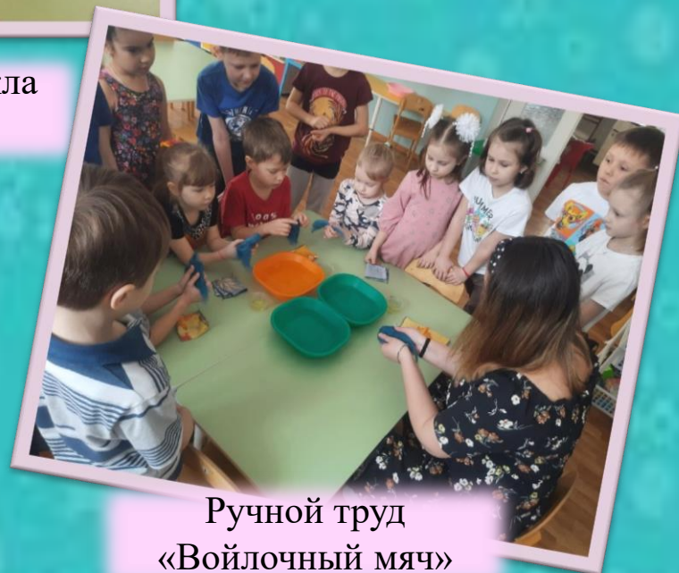
Ручной труд «Войлочный мяч»