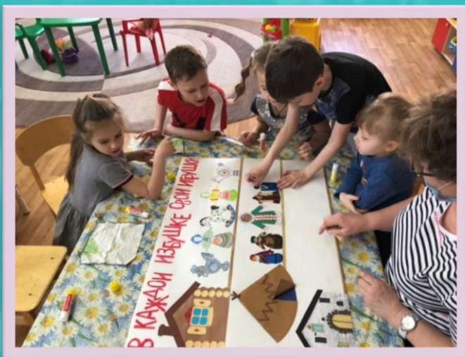
Коллективная развивающая игра «В каждой избушке своя игрушка»