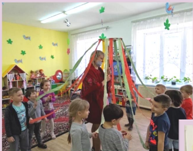
Знакомство с русскими народными игрушками