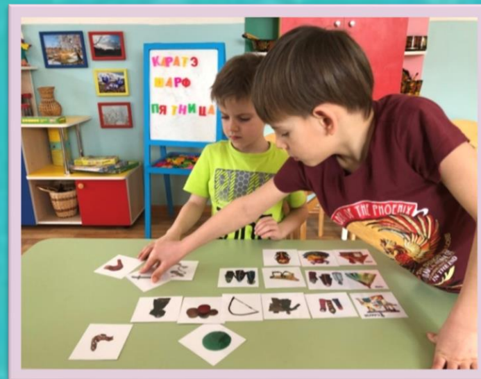
Дидактическая игра «Из какой избушки игрушки»